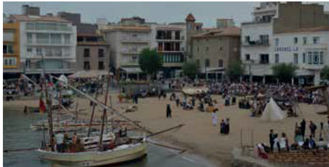
Mostra d'oficis mariners.