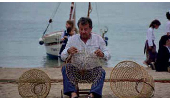
El nansaire.