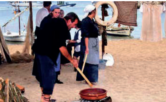
Anar a fer tenda.