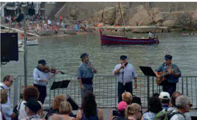
Grup d'havaneres Oreig de Mar a la Festa de la Sal 2018.