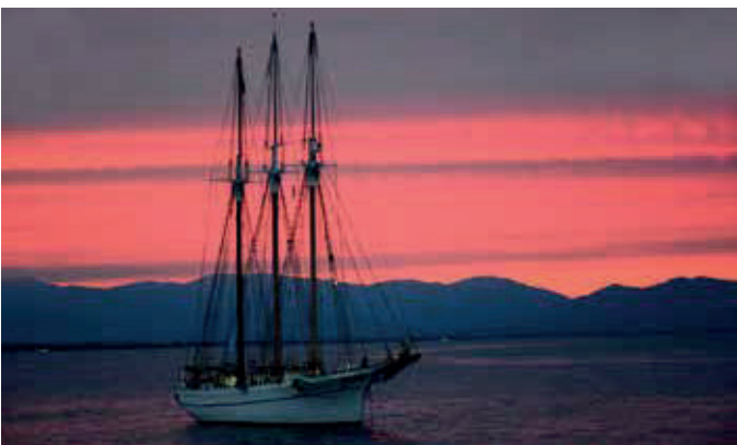
El vaixell de la sal (pailebot Sta. Eulàlia del Museu Marítim de Barcelona) a la Festa de la Sal de l'Escala, 2018.