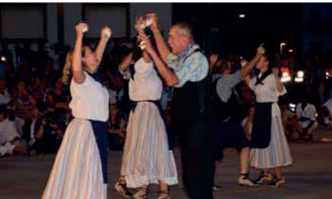
Ball de Nyacres de la badia de Roses.