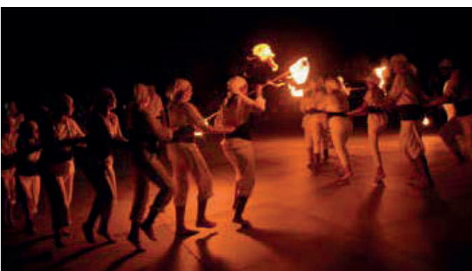
Ball del Drac de l'Escala.