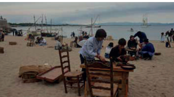
Aprenents de barrillers.