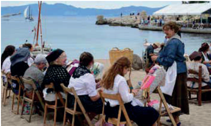
Les puntaires.

CERCABARS Cercavila de cançons pels bars i tavernes de la Platja amb el COR INDIKA de l'Escala. Recorregut: Ultramar, Kairos Bistrot l'Escala, La Riba, Grillats Empordà Burguer, Restaurant-Bar 1869, Geladeria Zuccherò, Cal Galàn, El Grop, Anxoves Solés, La Punxa, Cafè del Mar, La Caravel·la, Pastisseria Juhé, Taverna de la Sal, Geladeria La Jijonenca, Set de Tapes, Casablanca i Medusa