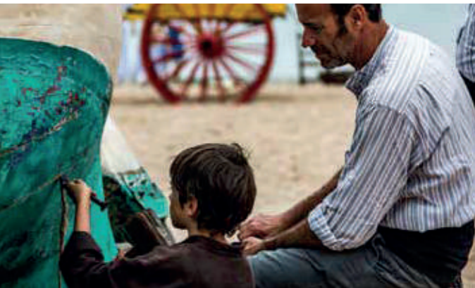
El mestre d'aixa.