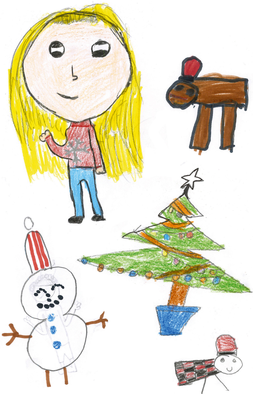
Dibuixos de l'alumnat de 3r de l'Escola FEDAC Sant Narcís.