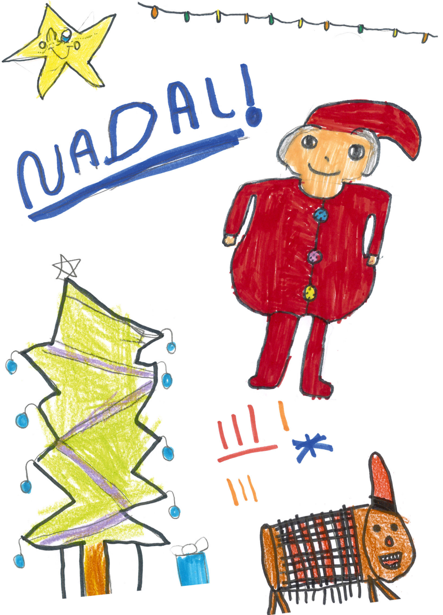
Dibuixos de l'alumnat de 3r de l'Escola FEDAC Sant Narcís.