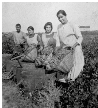
Fent verema a prop de can Piferrer (Veïnat de Moscaroles, Cassà de la Selva) Imatge de l'exposició "TEMPS PASSATS, TEMPS EN BLANC I NEGRE"

Selecció d'imatges en gran format de la col·lecció de fotografies que la família Dalmau va realitzar en la primera meitat del segle passat. Són imatges en blanc i negre on les activitats i els protagonistes formen part d'un passat que ja ens és llunyà. Moltes de les fotografies van ser fetes a can Dalmau (veïnat Mosqueroles de Cassà de la Selva) i altres masos o indrets propers.