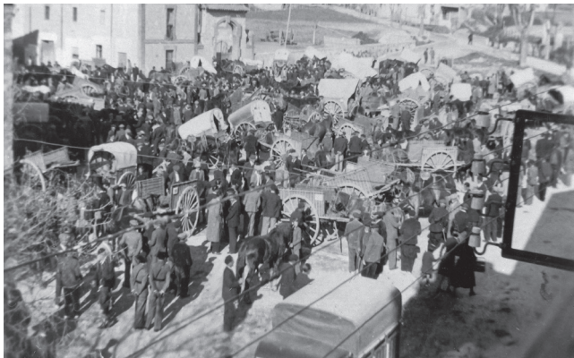
Fira de Sant Andreu a la plaça del Lledoner. Princ. s. XX

En la seva 22a edició, no et perdis aquesta cita ineludible amb la història i els racons de Torroella!!!