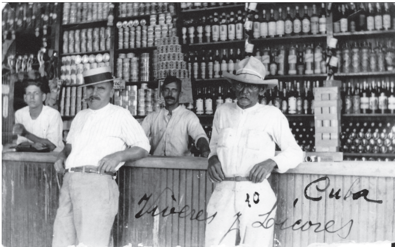
Cuba principis de segle XX